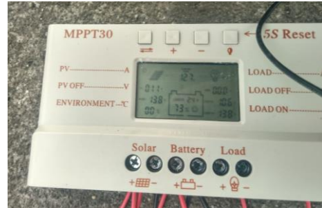
Gambar 5. Charger Control

Proses pengisian daya dari PV ke baterai, dilakukan dengan peralatan charger control. Di dalam charger control terdapat Maximum Power Point Tracking (MPPT) yang bekerja dengan metode Pulse Width Modulation (PWM). Charger control juga memiliki peranan memutus aliran daya dari PV ketika kondisi baterai telah penuh secara otomatis[16]. Charger control yang digunakan memiliki kapasitas 30 A dan dilengkapi dengan indikator kapasitas baterai[17].