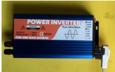
Gambar 3. Inverter PSW VISARO 500 watt

merek VISERO 500 watt karena daya yang dibutuhkan untuk melakukan supply ke pompa air sebesar 300 watt. Beban motor sangat berpengaruh terhadap kualitas gelombang sinus yang dihasilkan oleh inverter[13]. Apabila gelombang sinus yang dihasilkan tidak memiliki kualitas yang bagus, hal tersebut dapat berpengaruh pada putaran motor mesin pompa air[14]. Inverter PSW digunakan karena dapat menghasilkan gelombang sinus yang baik serta efisiensi diatas 90%.