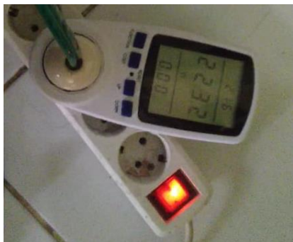
Gambar 8. Pengukuran Daya Pompa Air

Penurunan kapasitas debit air dipengaruhi oleh panjang pipa dari sumber air menuju bak penampungan air sepanjang 28 meter, dengan posisi tandon berada pada ketinggian 5 meter diatas tanah.