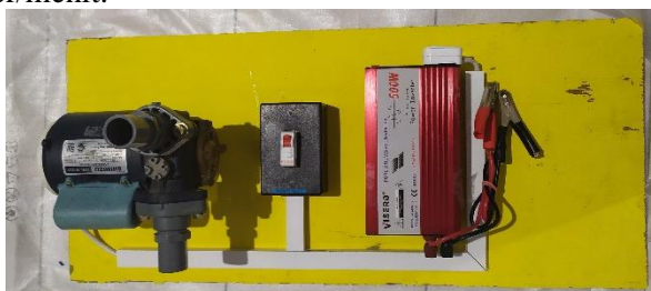
Gambar 7. Perakitan Inverter Dengan Mesin Pompa Air

Pengujian dilakukan dengan mengukur kecepatan debit air yang mampu dialirkan oleh pompa air dengan daya yang dibutuhkan oleh pompa air tersebut. Dalam perhitungan debit air, pompa air mampu mengalirkan air dengan volume 8,5 liter/menit.