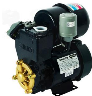
Gambar 4. Shimizu PS-135 E