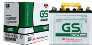
Gambar 2. Baterai GS Hybrid

Dalam penentuan kapasitas baterai, dilakukan analisa perkiraan penyimpanan baterai, dengan kebutuhan beban harian dalam penggunaan mesin pompa air [10]. Baterai yang digunakan memiliki kapasitas 50 Ampere dengan tegangan 12 V. Baterai tersebut berjenis aki hybrid dengan merek GS HYBRID 50 A. Baterai tersebut dipilih karena perawatan yang mudah serta dapat dilakukan pengisian berulang kali. Selain hal tersebut, kapasitas baterai juga menjadi pertimbangan guna mampu digunakan untuk mensuplai daya mesin pompa air melalui inverter[11].