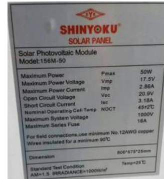
Gambar 1. Spesifikasi Panel Surya

PV 50 WP dirangkai secara paralel. PV yang digunakan berjenis monocrystal dengan merek SHINYOKU. Dalam waktu satu hari, mampu memperoleh daya maksimum selama 4 jam dan pada cuaca cerah mampu menghasilkan daya hingga 600 watt dalam hitungan hari[9].